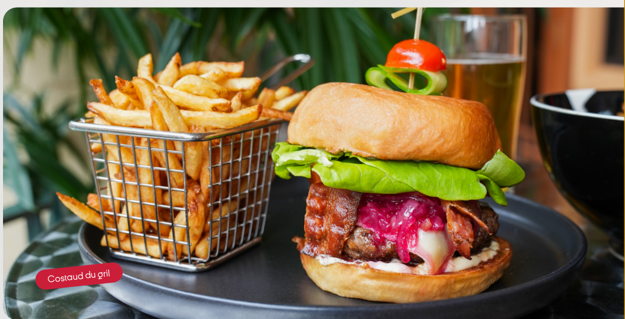
Costaud du grill