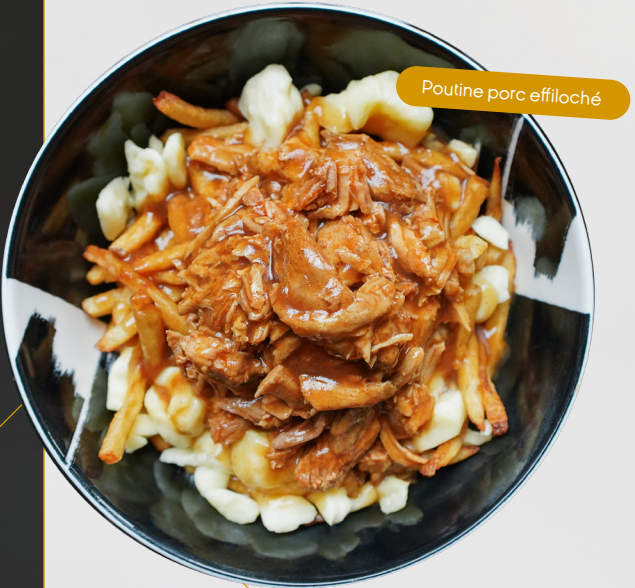
Poutine porc effiloché