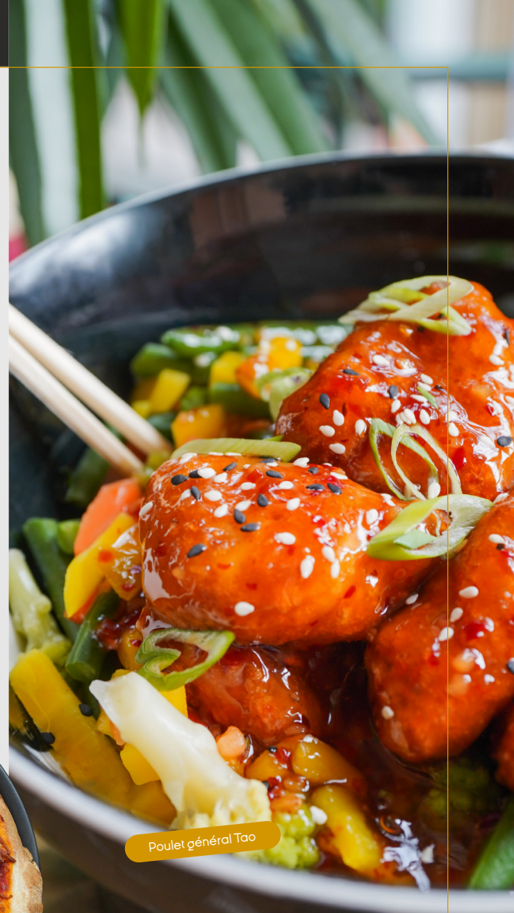
Poulet général Tao