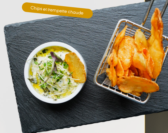
Chips et trempette chaude