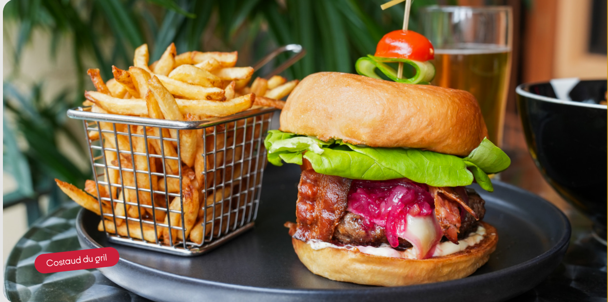
Costaud du grill