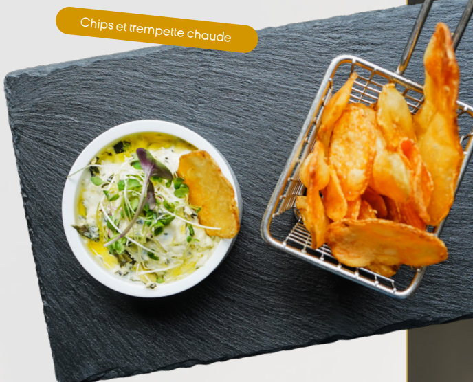
Chips et trempette chaude