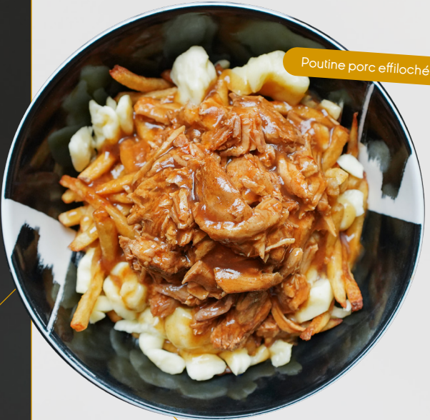
Poutine porc effiloché